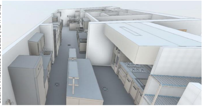
Cuisine Ambassade de Suisse (KCA Archit)