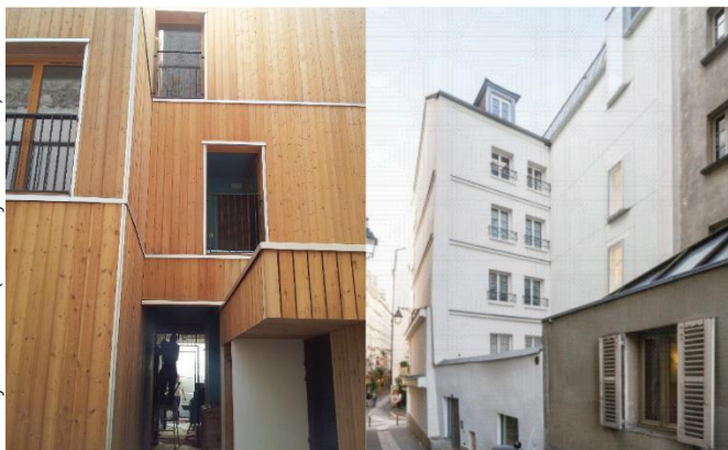
Rue Myrha - Paris (North by Northwest)

Description : Construction d'un immeuble de 4 logements et d'un local d'activités Mission : Fluides - HQE Montant des travaux HT : 1 489 000 € Livraison : 2014 Particularité : Construction en béton de chanvre