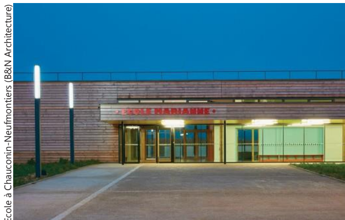
Ecole à Chauconin-Neufmontiers (B&N Architecture)