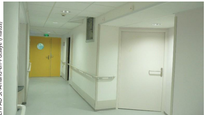
EHPAD St-Amand-en-Puisaye (Hiatus)

Atelux Ingénierie SAS est doté d'équipements informatiques et de communication, de logiciels les plus performants et les mieux adaptés aux missions correspondant à ses domaines de compétences (traceur AO, scanner, logiciels Autocad, Project, logiciels de calcul thermique et électrique...).