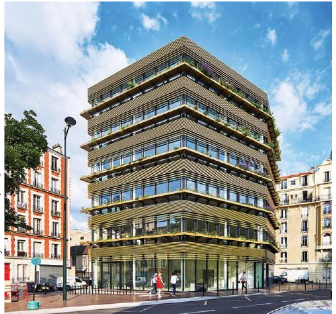
Bureaux - Clichy-la-Garenne (B+C)