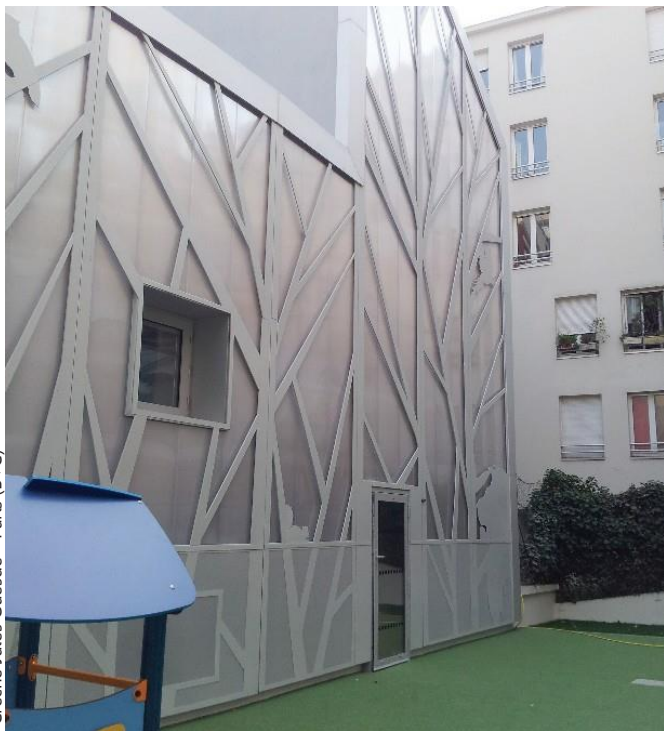
Crèche Jules Guesde - Paris (B+C)